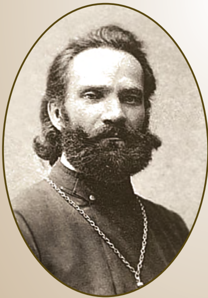
Протоиерей Константин Околович (1872–1933)