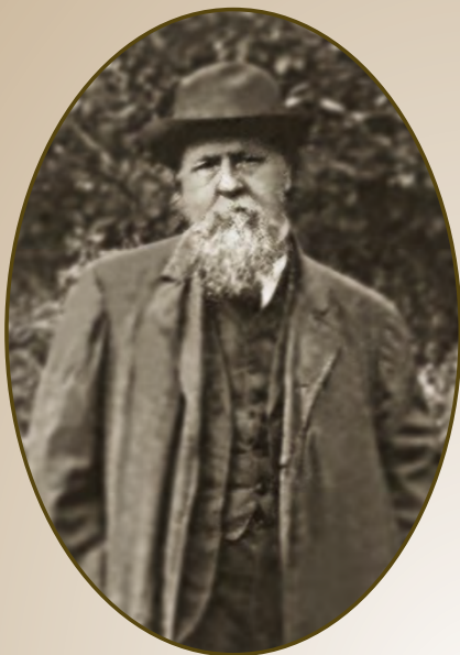
Булгаковский Дмитрий Гаврилович (1843–1920)