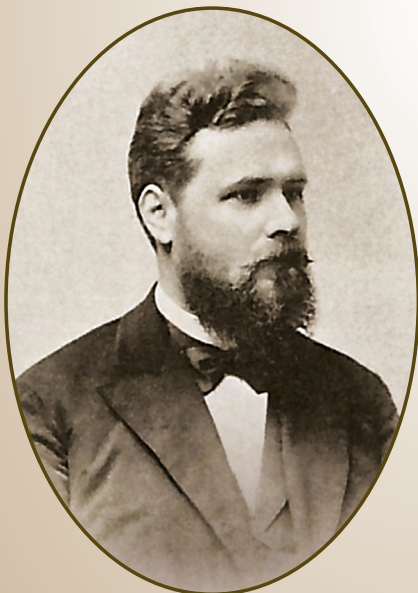
Карский Евфимий Федорович (1860–1931)