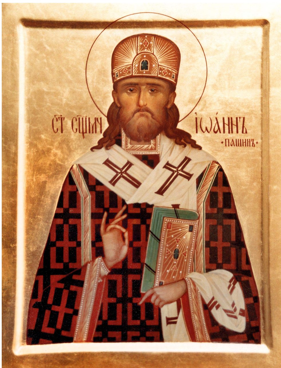
Священномученик Иоанн (Пашин) (1881–1938)