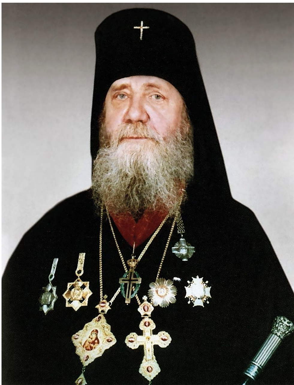
Архиепископ Пимен (Хмелевский) (1923–1993)