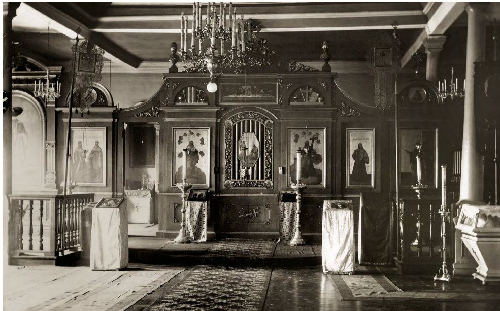
Церковь Минской духовной семинарии. Фото 1914 г.