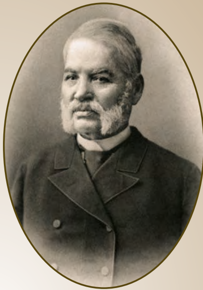
Мальшевский Иван Игнатьевич (1828–1897)