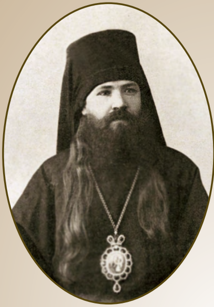
Епископ Климент (Верниковский) (1863–1909)