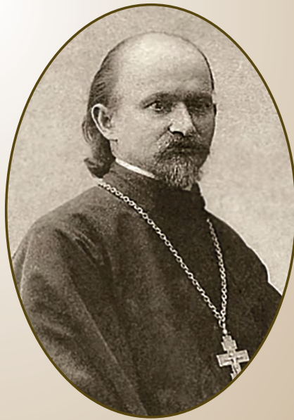
Протоиерей Вячеслав Якубович (1868–1927)