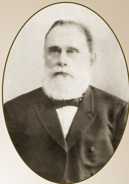
Прокопович Фавст Варфоломеевич (1842–1912)