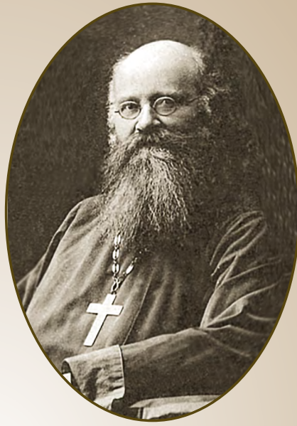
Протоиерей Андрей Юрашкевич (1854–1921)