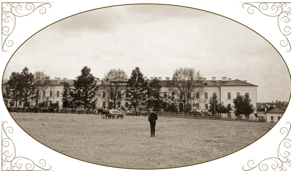
Минская духовная семинария. Фото нач. XX в.