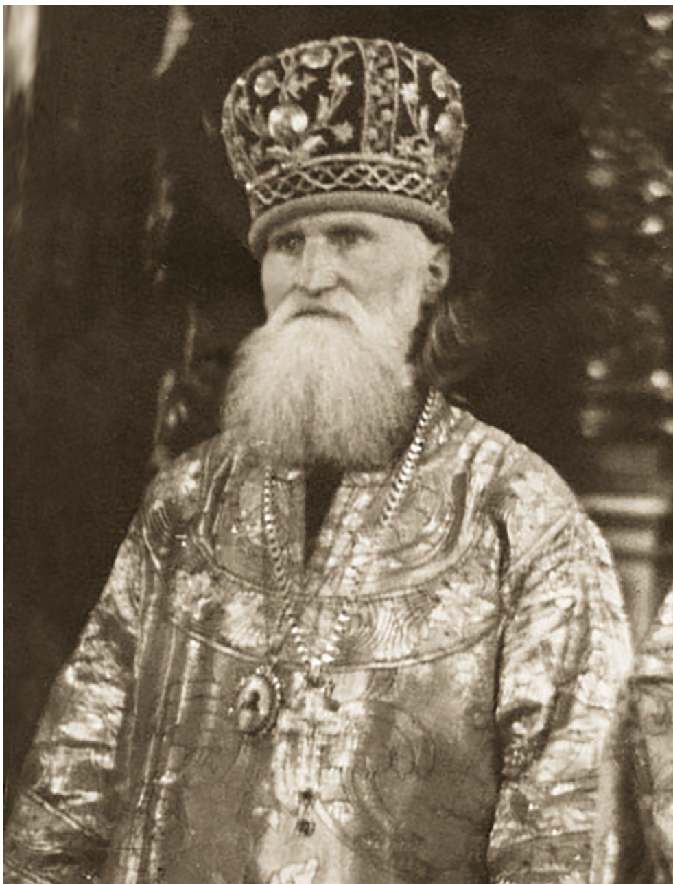
Архиепископ Стефан (Севбо) (1872–1965)