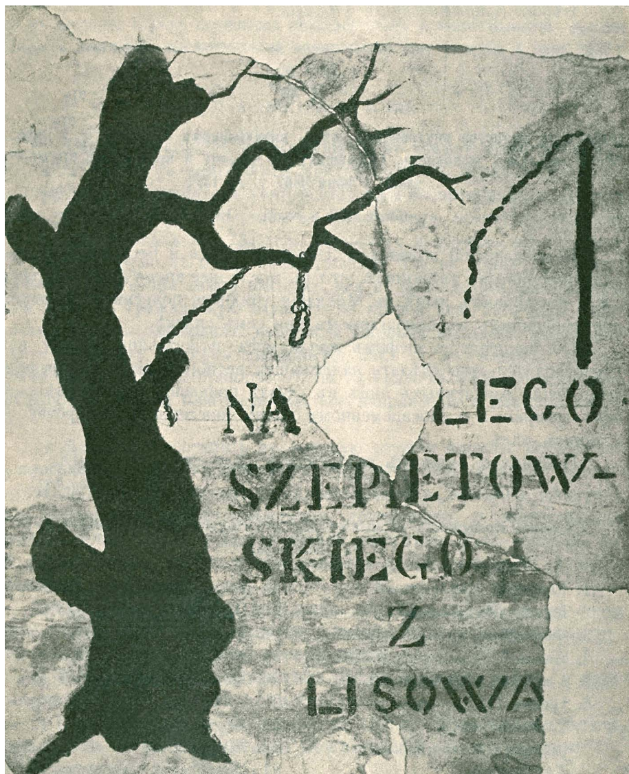
Подобные листовки поляки распространяли накануне восстания 1863–1864 годов