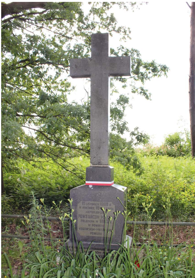
Крест, установленный в 1928 году на старом католическом кладбище города Косово на могиле повстанцев Красинского, Лукашевича и неизвестного (2013 год)