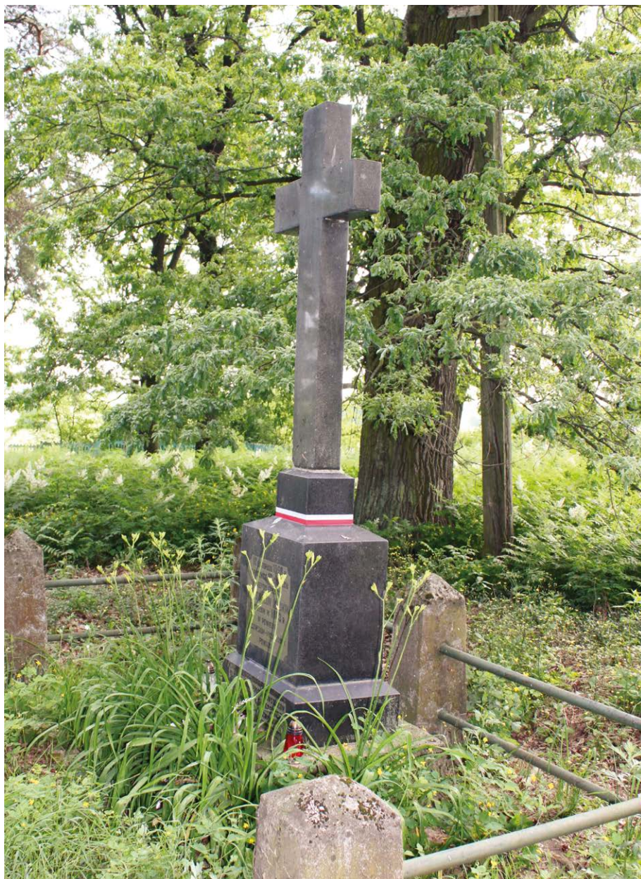
Памятник, вид сбоку (2013 год)