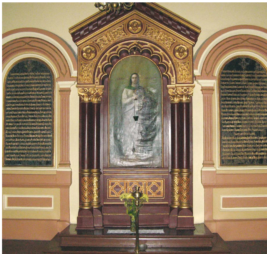
Памятные гранитные доски с именами жертв польского восстания 1863–1864 годов в Пречистенском соборе города Вильнюса