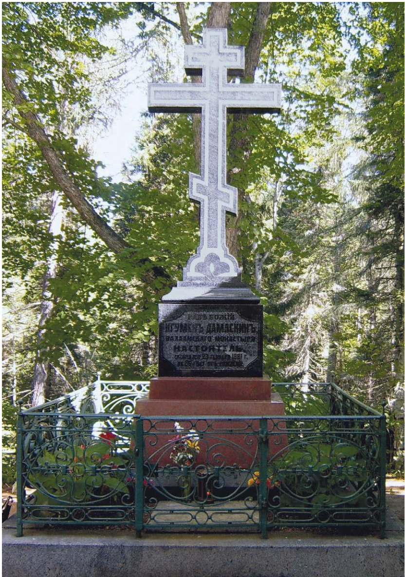
Памятник на могиле игумена Дамаскина (†1881) на Игуменском кладбище Валаамского монастыря (2007 год)