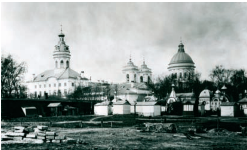
Александрo-Невская Лавра. 1913 г.