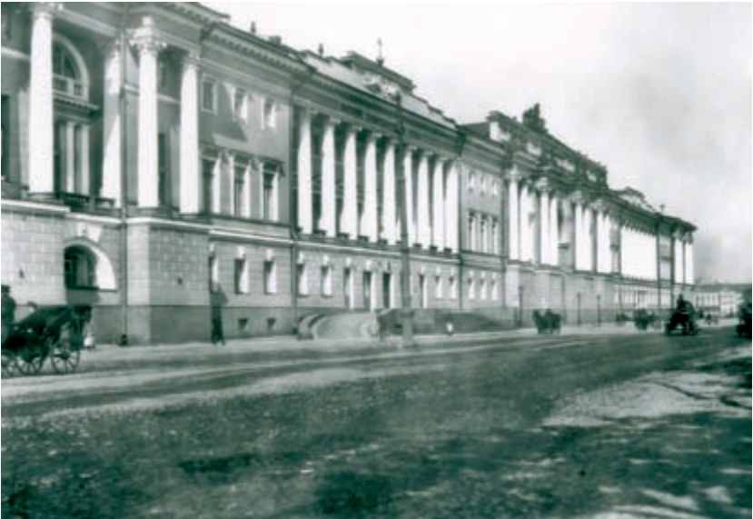
Здание Правительствующего Сената и Святейшего Правительствующего Синода. Фото начала XX в. (ЦГАК СПб. Ед. хр. В-4633)