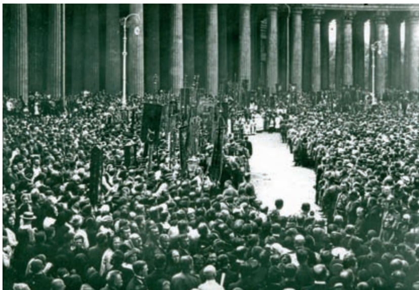
Молебен о даровании победы у Казанского собора. июль 1915 г.