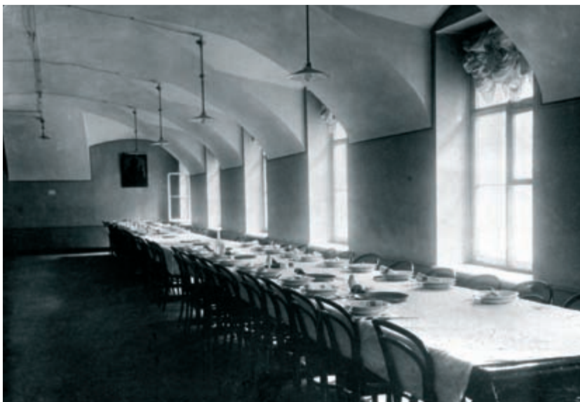
Трапезная С.-Петербургской духовной академии. Фото конца XIX – начала XX в.