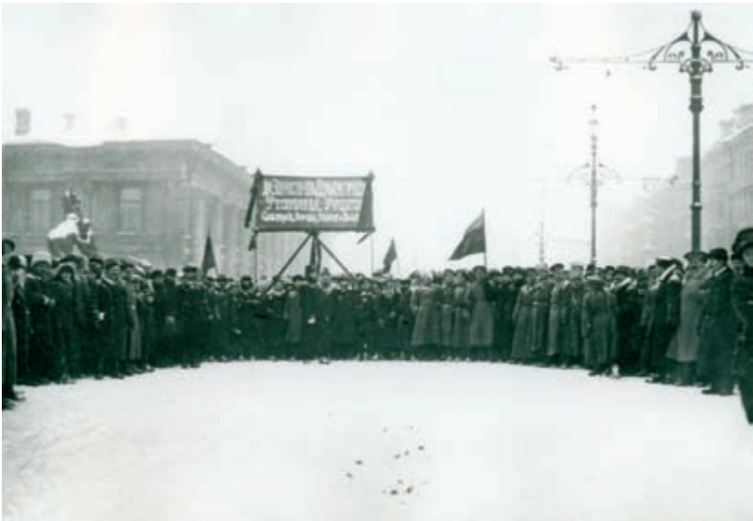
Первые дни Февральской революции. Демонстрация на Невском проспекте у Аничкова моста. Март 1917 г.