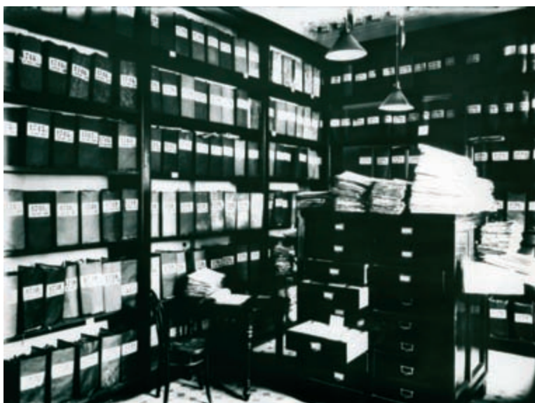
Помещение архива Александрo-Невской Лавры. Фото К.К. Буллы, 1913 г. (ЦГАК СПб. Ед. хр. Д-12126)