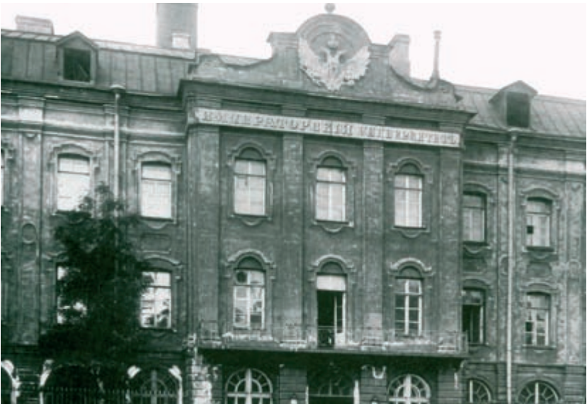
Здание Императорского С.-Петербургского университета. Фото начала XX в.