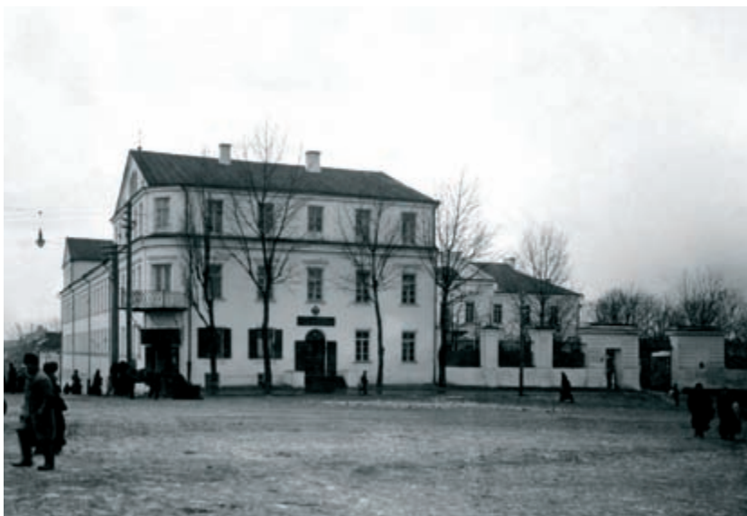
Здание Минского духовного училища. Фото начала XX в.