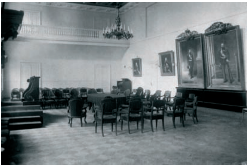
Рекреационная зала С.-Петербургской духовной академии. Фото конца XIX – начала XX в.