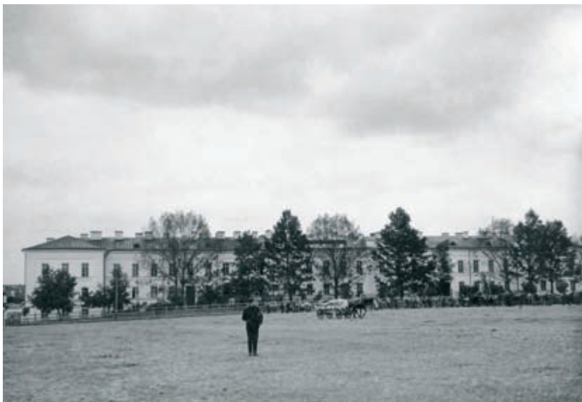
Здание Минской духовной семинарии. Фото начала XX в.