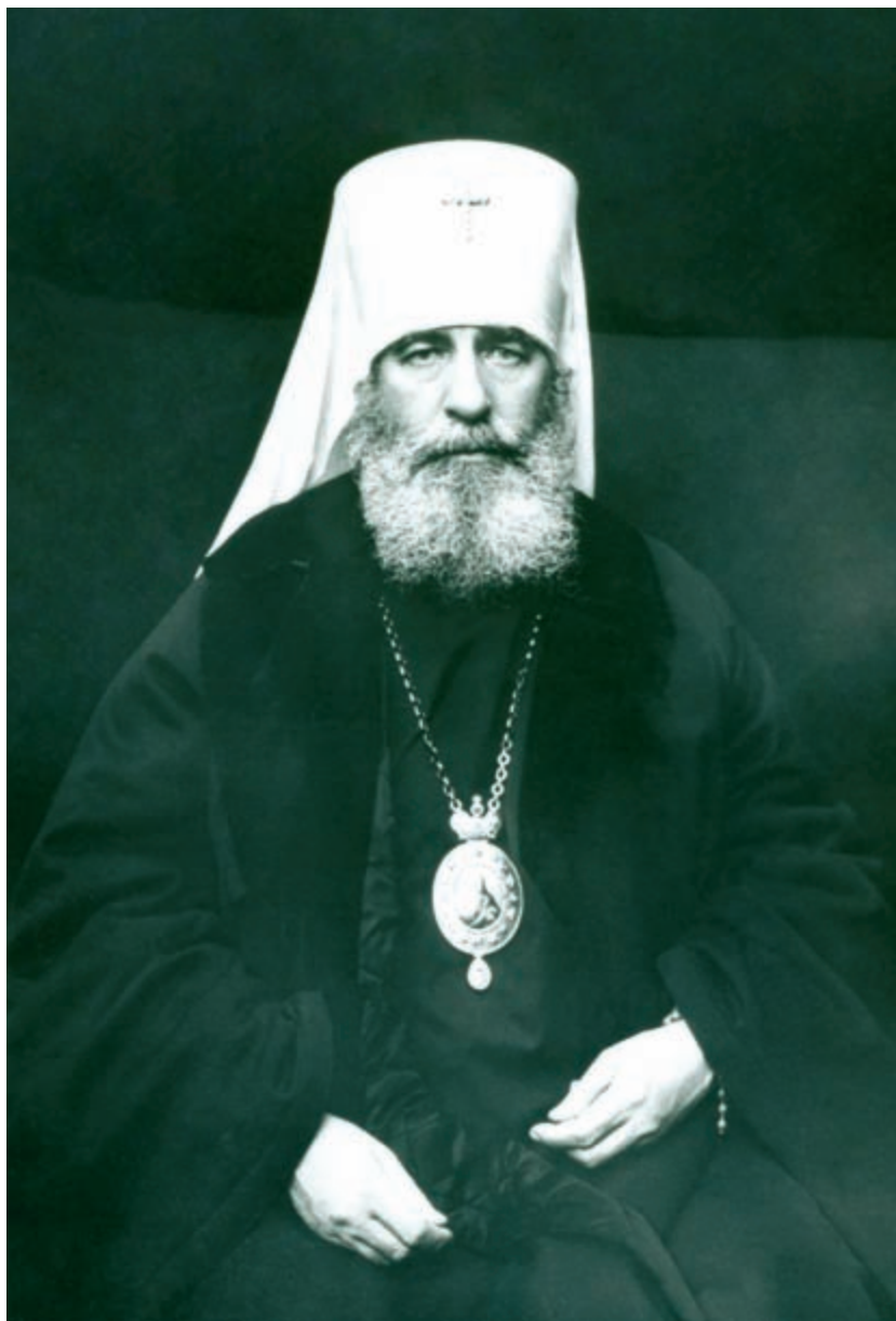
Митрополит Санкт-Петербургский и Ладожский Антоний (Вадковский). 1911–1912 гг.