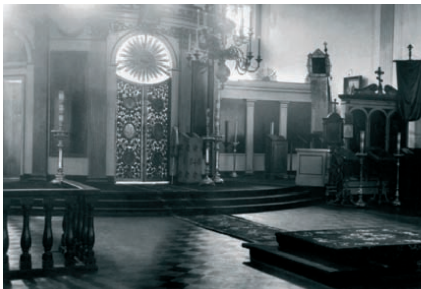
Академическая церковь. Фото конца XIX – начала XX в.