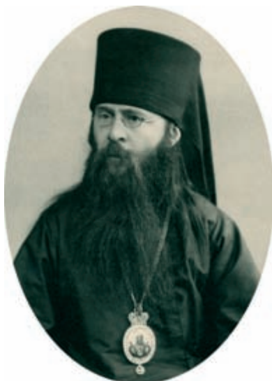
Епископ Сергий (Страгородский)