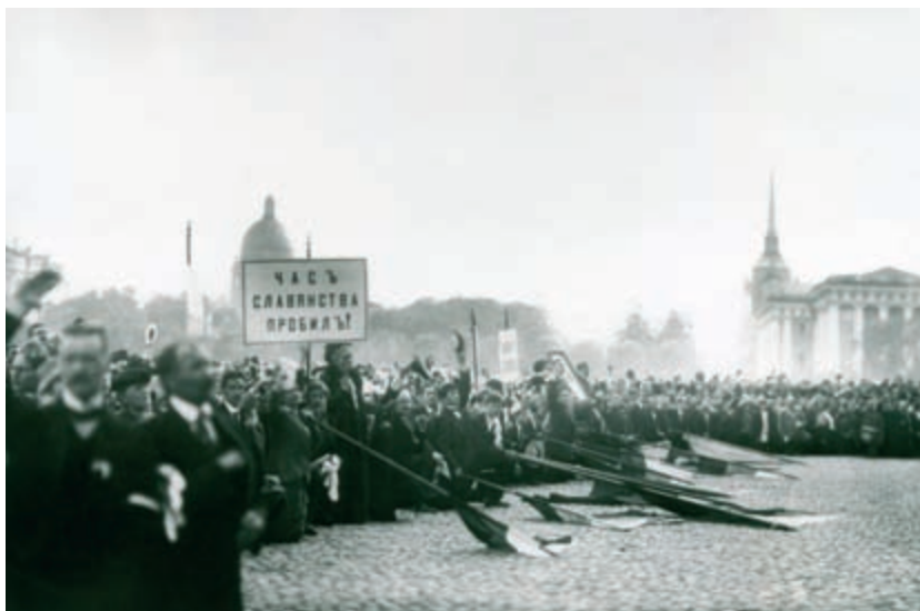
Патриотическая манифестация на Дворцовой площади перед Зимним Дворцом (со стороны Александровского сада) перед чтением царского манифеста о начале войны. Фото К.К. Буллы, 20 июля 1914 г. (ЦГАК СПб. Ед. хр. Д-484)