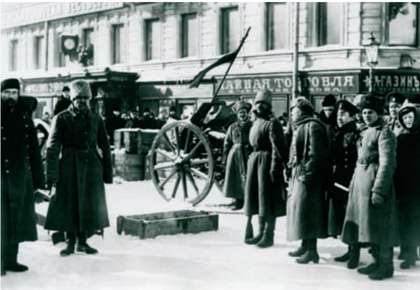
Петроград. Баррикада на Литейном проспекте. Петроград, начало 1917 г.