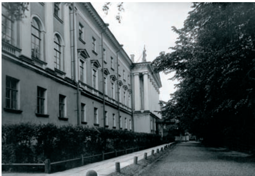
Здание С.-Петербургской духовной академии. Фото конца XIX – начала XX в.